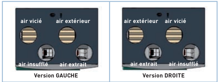
Fig 1: Versions d'exécution

Nous nous réservons le droit d'apporter des modifications techniques.